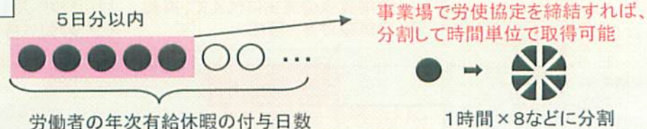
【図】時間単位年休の仕組み

(注3) 例えば、労働者が日単位で取得することを希望した場合に、使用者が時間単位に変更することはできません。